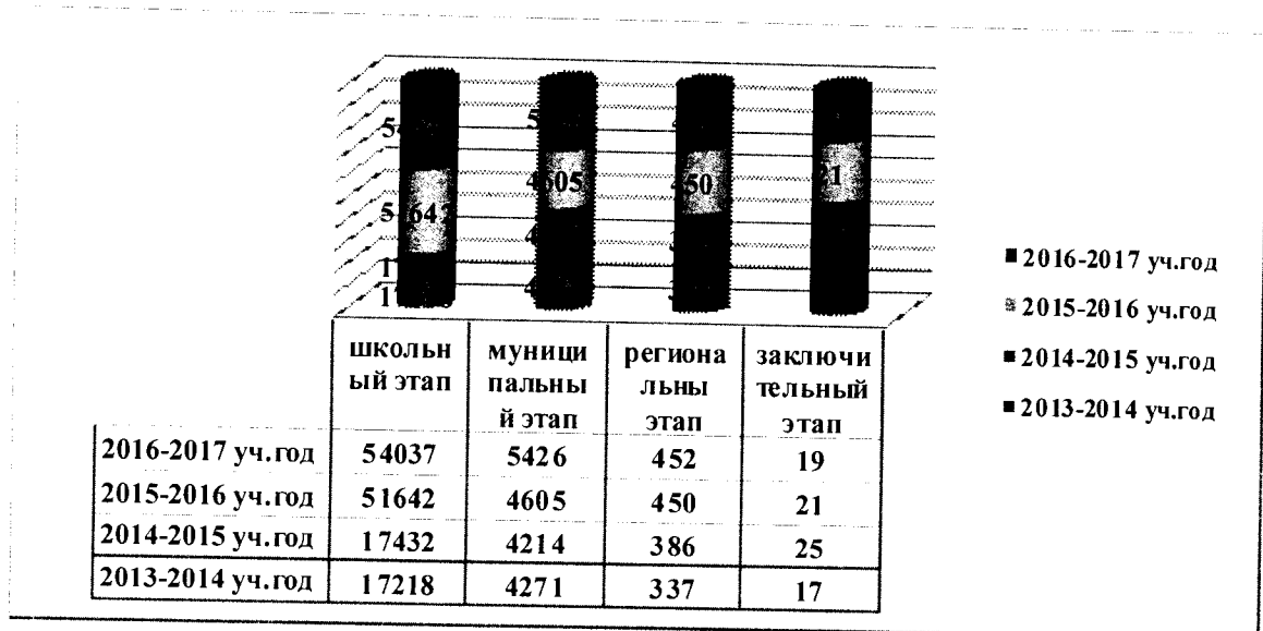
Показатели участия школьников городского округа «город Якутск» на региональном этапе Всероссийской олимпиады школьников и Государственной олимпиаде школьников РС(Я)

Мониторинг участия школьников городского округа «город Якутск» на Всероссийской предметной олимпиаде показывает, что результаты участия детей на муниципальном и республиканском уровнях ежегодно улучшаются.