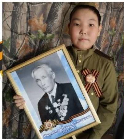
Скрябин Петр Алексеевич